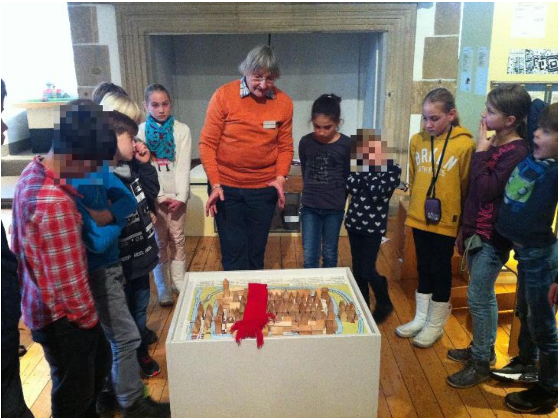
Der große Brand Rodenbergs 1859