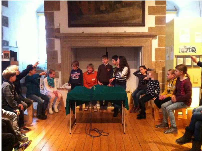
Entdeckungsreise der Berge rund um Rodenberg

Im Zuge einer Sachunterrichtseinheit zum Thema „Rodenberg“ hat die Klasse 4b der Julius-Rodenberg-Schule am 22.11.2017 das Heimatmuseum in Rodenberg besucht.