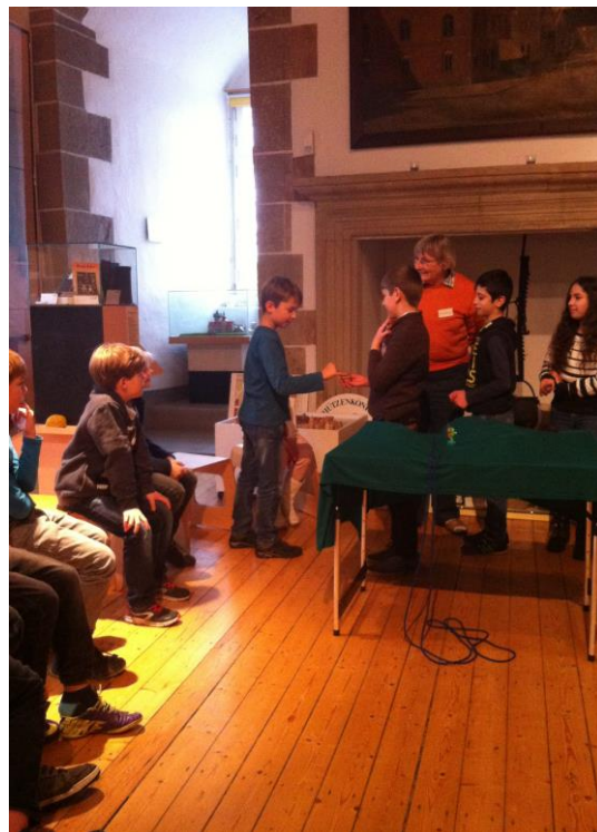
Kostprobe eines wahren Bodenschatzes: Salzstein